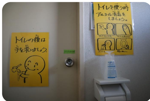
トイレ内での除菌のお願い!