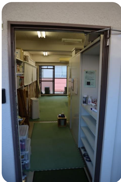
ベランダ側の窓も開け放し