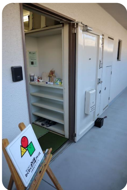
入口のドアは開け放し