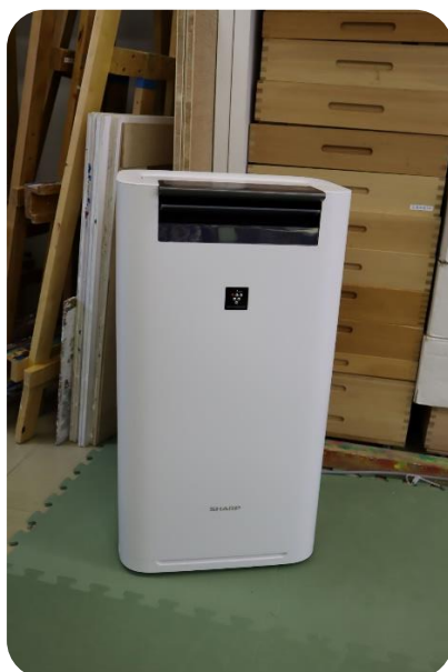
空気清浄機を設置しました