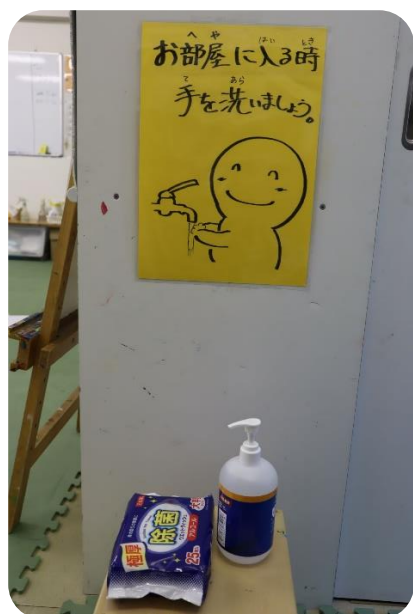
入室したらまず、手洗いを!