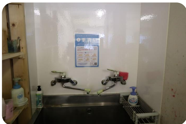
手洗いを頑張ろう!