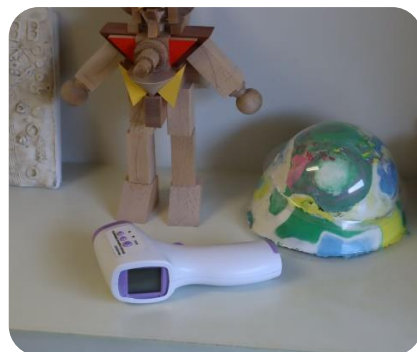
非接触型体温計を用意しました